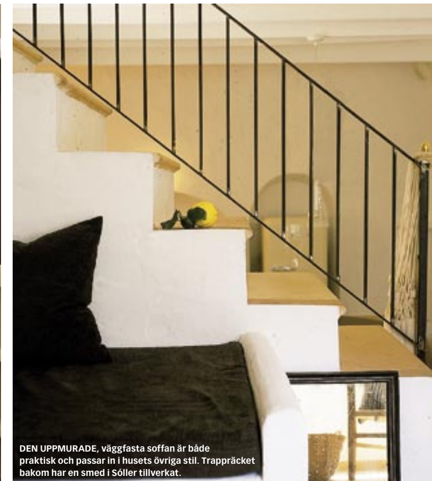
DEN UPPMURADE, väggfasta soffan är både praktisk och passar in i husets övriga stil. Trappträcket bakom har en smed i Söller tillverkat.